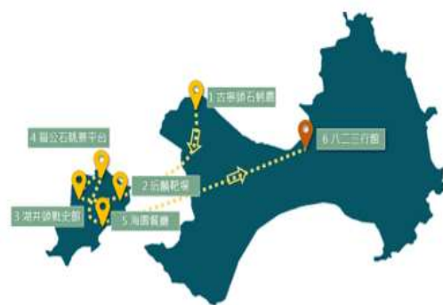
圖 5-2 本專題之旅遊地圖

終於到了晚餐時光，走進海園餐廳就聞到散發著芋頭香氣，每一口美食都擁有當地獨特風味，嘴裡散發著濃郁的芋頭風味，成為整個旅途中一個溫馨的收穫。最後回到八二三行館，心靈驛站再出發，不僅與大自然親密接觸，品味了當地美食還挑戰了各種活動，留下了豐富的回憶。如圖 5-2「本專題之旅遊過程」