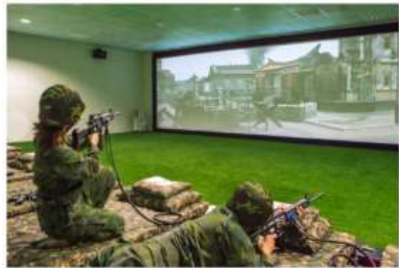
圖 1-1 后麟模擬靶場

本次遊程之規劃天數是三天兩夜以配合大家日常生活作息，另外，考慮藍眼淚的季節因此建議可以選擇於四到五月出團，因為該月適逢每年春天到夏天交接的季節，當時的天候情況正逢藍眼淚的好發時期，可以讓到訪遊客參觀到這個曾經被列為世