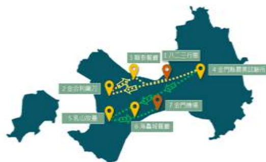
圖 5-3 本專題之旅遊地圖

最後為晚餐前往海蠡城餐廳，這家餐廳以新鮮的海鮮食材聞名，酥炸魚片是必點之一，品嚐金門特有的美食，留下對當地的美食印象，成為整個旅程中美好的壓軸之選。享受完晚餐時刻，我們快速前往機場的途中，再次感受到低碳永續綠運輸的環保理念，登上華信 MDA AE1278 於晚上 8 點的航班，即將為這趟旅程畫下了完美的句點，在前往高鐵的途中回顧整個旅程，每一個場景都難以忘懷，體會獨特的自然風光和歷史文化，更深刻感受低碳生活和永續發展的重要性。喚起對環境保護的思考，期待再次來到這美麗的土地。如圖 5-3 「本專題之旅遊過程」